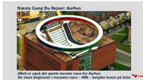
Billede: ARoS ses af 200.000 pr. dag

Ligesom i "Indenfor 10 Minutter" bliver togpassagerer - og i øvrigt hotelgæster på 11 tophoteller i København - inviteret på en visuel flyvetur til interessante oplevelser.