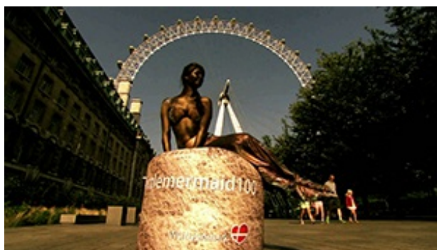
Billede: vnr.TV producerede og skaffede 380 mio seere til VisitDenmark

Kampagnen blev set af mindst 380 millioner faktiske seere.