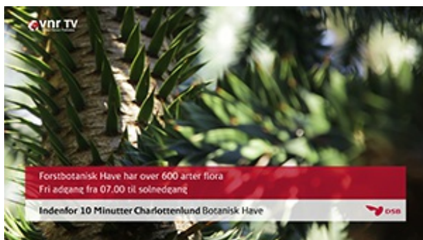
Billede: Indenfor 10 Minutter - Charlottenlund

"Næste Gang Du Rejser" hedder den del, der handler om steder i hele Danmark.